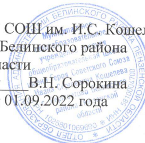
График посещения пищеблока членами комиссии по родительскому контролю за организацией питания обучающихся на 2022-2023 учебный год.